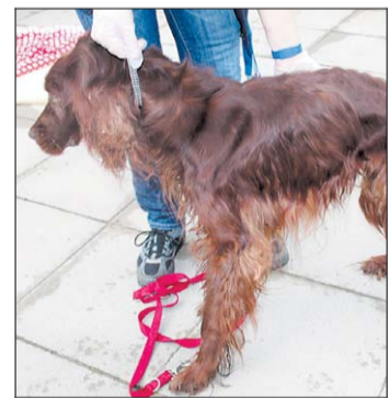
Setter Balu hat sich im Tierheim mittlerweile erholt.