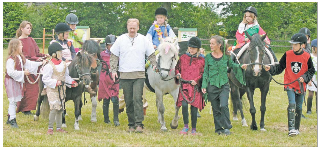
Viel Beifall gab es beim Tag der offenen Tür im Bilsener Betrieb Fister für die Kinder, die mit ihren Ponys ein Märchen aufführten.

Treffen diese Eckdaten auf das Tier zu, melden sich Hunde- oder Katzenbesitzer in der Tierklinik Norderstedt, Kabels Stieg 41. Hier nimmt ein Tierarzt dem Tier etwas Blut für die Blutgruppenbestimmung und für ein Blutbild ab. Alle tierärztlichen Leistungen sind kostenlos. Anschließend erhält der Tierhalter eine exklusive Spendemarke für Hunde, einen Blutspendeausweis und eine Aufwandsentschädigung von 15 Euro.